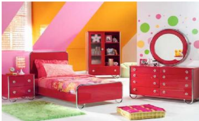
شکل 4- دکوراسیون اتاق کودکان