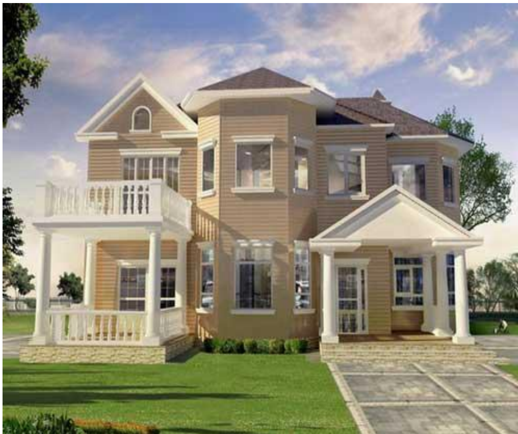
شکل 6- دکوراسیون خارجی ساختمان

دکوراسیون خارجی خانه و رنگ های استفاده شده در آن نقش بسیار مهمی در تاثیرات روحی و روانی افرادی که وارد خانه می شوند دارد و می تواند سبب شود که انرژی های منفی و سمی در دکوراسیون خارجی جریان یابد و یا به کلی حذف شود. اینکه انرژی مثبت آرام حرکت کند یا حرکتی سریع داشته باشد (که هر دو حالت نامناسب است) بستگی به نوع دکوراسیون و رنگ های استفاده شده در دکوراسیون دارد. نوع انرژی ای که در فضای خارجی خانه شما به جریان می افتد تاثیر زیادی در نوع روابط همسایگان با هم و هم چنین احساس مهمانان شما و ذهنیت آن ها در مورد دکوراسیون داخلی خانه شما خواهد داشت (10) (شکل 6).