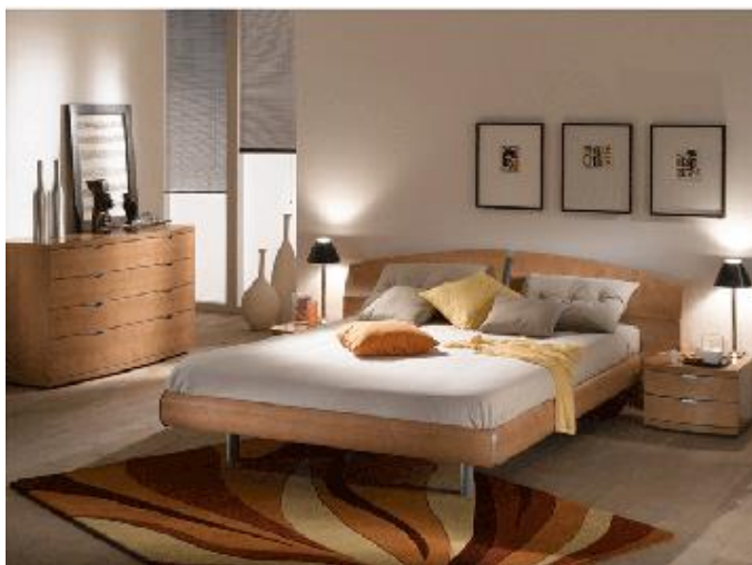
شکل 3- دکوراسیون اتاق خواب

غنا جذابیت این دکوراسیون را دوچندان می کند. برای نیل به موفقیت در ترکیب سطوح طرحدار گوناگون در چنین دکوراسیونی لازم است سطوحی ساده و روشن به منظور استراحت چشم در فضای اتاق در نظر گرفته شوند که رنگ ساده و روشن روی دیوارهای اتاق می تواند این نقش را به خوبی ایفا کند. همچنین آویزهای پارچهای در قسمت بالا و پشت تخت فضایی رماتیک و خاص به اتاق می بخشد و می تواند تختخواب را بیش از پیش به کانون توجه در اتاق تبدیل کند. در مقابل دکوراسیون های سنتی دکوراسیونهای تک رنگ قرار گرفته اند که با به کارگیری تنالپته های مختلف یک رنگ فضایی آرام و یکنواخت را پدید می آورند. رنگهای روشن نمای آفتابی و پرنشاط و در همان حال ساده و آرامش بخش را در برابر دیدگان بیننده قرار می دهند. ترکیب رنگهای زرد و سبز از آنجا که سبز یکی از رنگهای مشتق شده از زرد است، در فضای اتاق خواب بسیار موفق و مناسب خواهد بود. اما باید به خاطر داشته باشیم که غالب شدن رنگ سبز بر زرد در یک اتاق نشیمن بر جذابیت و زندگی در آن می افزاید، اما در یک اتاق خواب اختصاصی قسمت اعظم فضا به رنگ زرد سادگی و آرامشی که لازمه یک اتاق خواب است به آن می بخشد؛ حال آن که غالب شدن رنگ سبز در اتاق خواب بیش از میزان لازم به فضا شور و انرژی میبخشد (شکل 3).