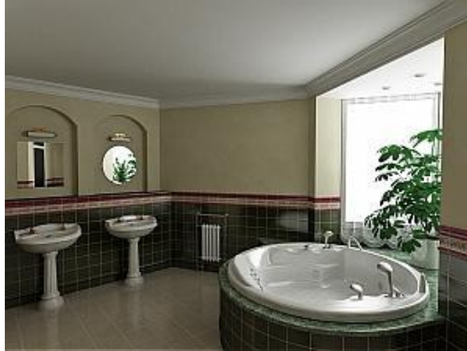
شکل 5- دکوراسیون حمام